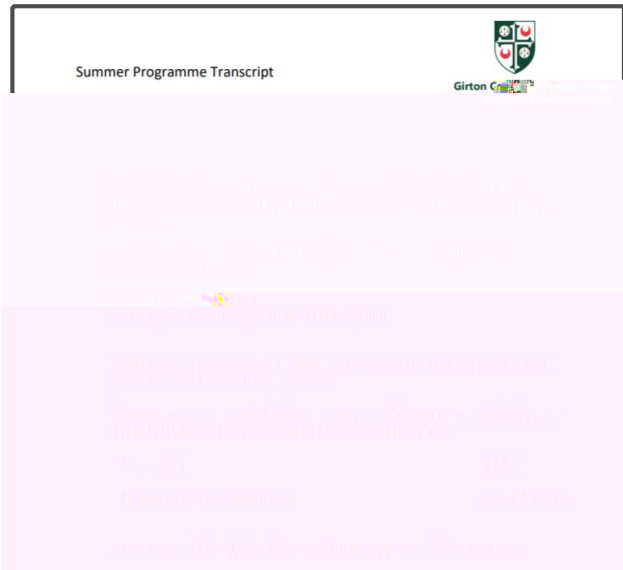
图：剑 大 学 书 与 单 图